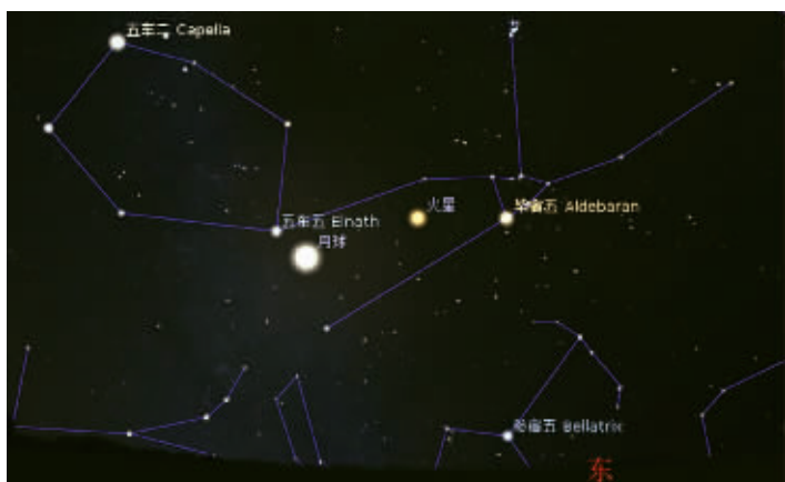
9月17日,火星、毕宿五合月 储希豪Stellarium模拟