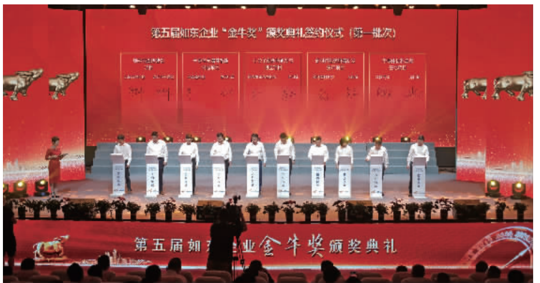
签约仪式现场

“站在这个奖台上,我百感交集。今天,县委县政府授予的这份终身荣誉,也是终身的压力,盛名之下,其实难副,我诚惶诚恐,余生