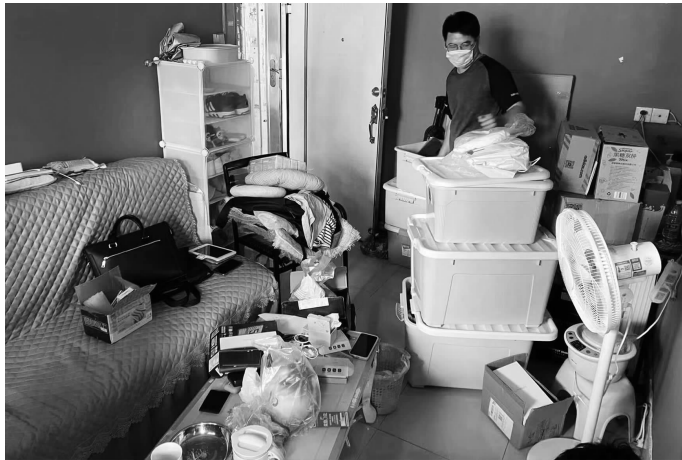
插座充电宝竟暗藏玄机 通讯员供图