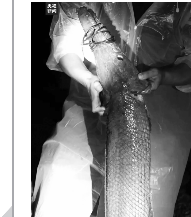
两条鳄雀鳝被捕获