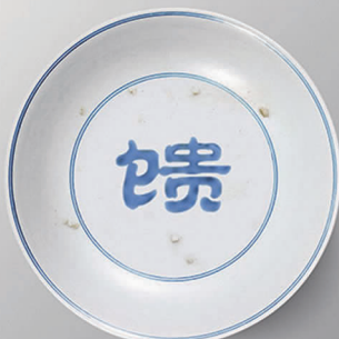
大德馈赠 拒绝浪费