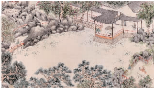
《瞻园消夏图》(局部)中的大水池