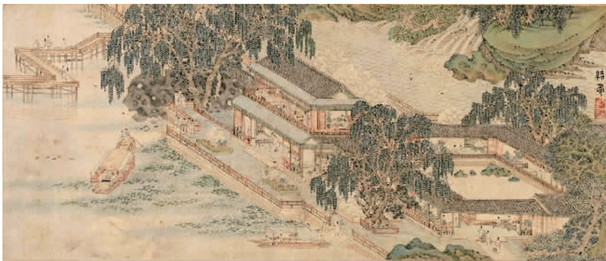
《岁华纪胜图册》之《结夏》