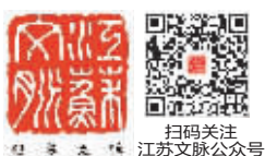
扫码关注 江苏文脉公众号