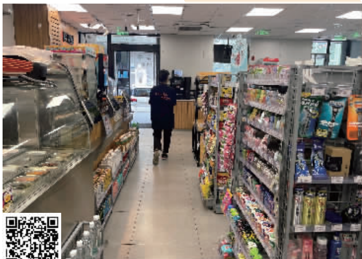
南京一家正常营业的便利蜂门店