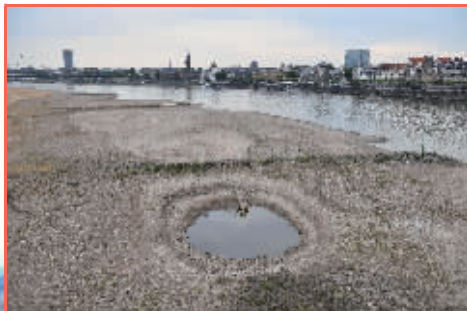
德国 莱茵河在德国境内多段出现不同程度水位下降