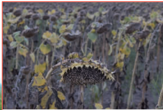
匈牙利 枯萎的向日葵