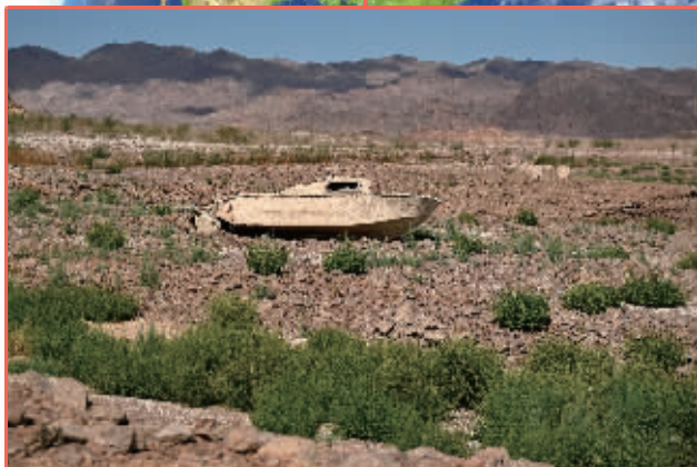
美国 米德湖因长期干旱导致水位下降,水底沉船也重见天日