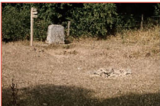
英国 干涸的泰晤士河发源地和一块写有“泰晤士河起点”的石碑