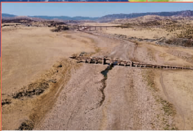
西班牙 干涸的锡哈拉水库