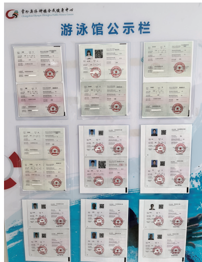
游泳馆救生员信息公示