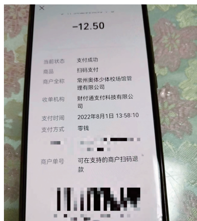
事发当天老人在游泳馆的消费记录