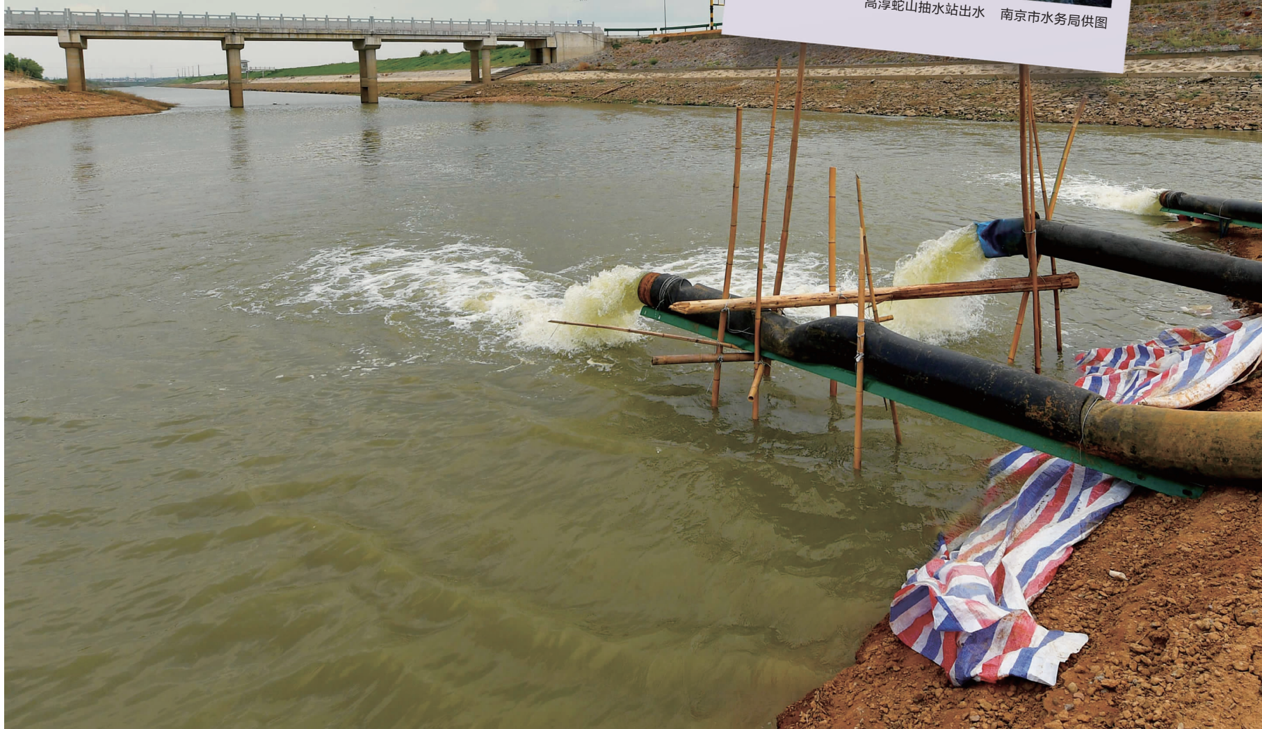
南京市溧水区石湫街道向阳村从石臼湖引水，灌溉农田