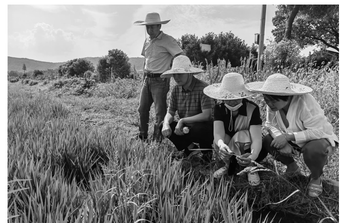
水稻专家踏田指导,普及防治水稻高温热害技术

农月无闲人,倾家事南亩。近期,持续的高温晴热天气,为农户带来了农作物“避暑”难题,对此,滨湖区农业农村局紧贴基层需求,主动靠前服务,会同水利部门邀请省市两级水稻专家,下沉一线、踏田指导,因地制宜向农户普及防治水稻高温热害技术,全力以赴保秋粮丰收。