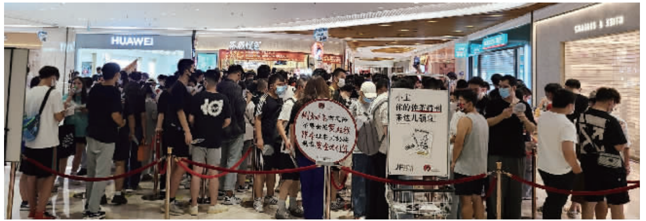
景枫店排队的人群