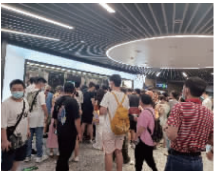
靠近新街口地铁站5号口的商场门口聚集了很多人