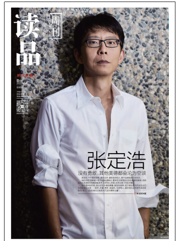
读品周刊本期看点