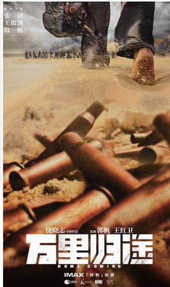
电影海报