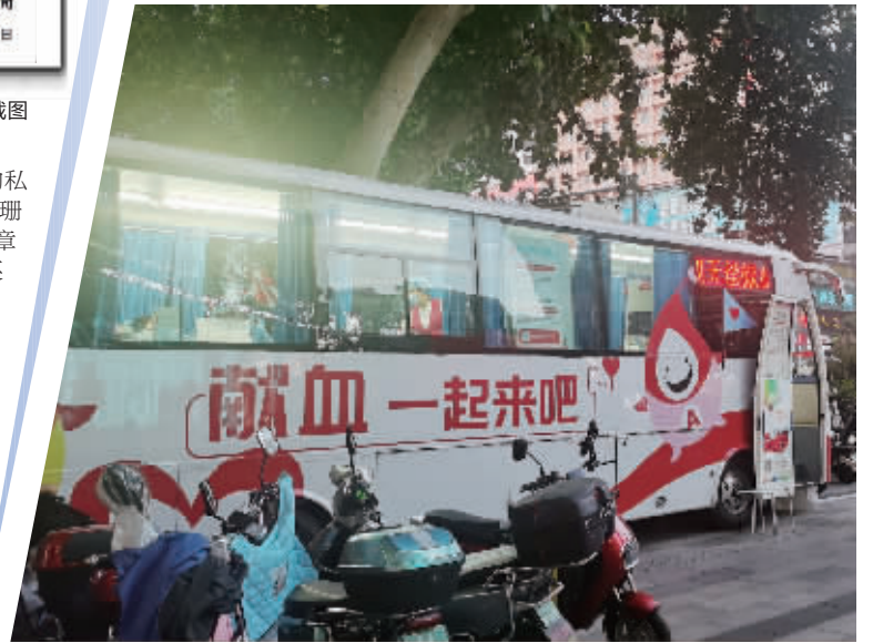
南京新街口地铁站附近的献血车