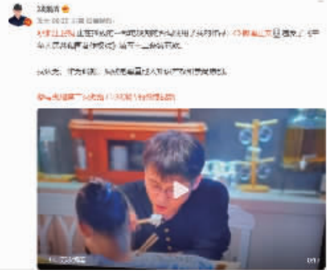
郑渊洁发文质疑抄袭一事 微博截图