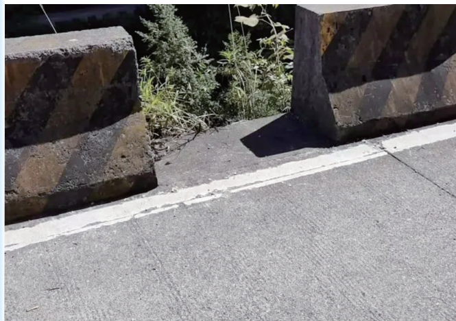
丈夫称贺女士是从水泥墩中间冲下去的