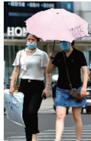
烈日炎炎,要做好防晒

8月的第一天,高温就到岗了,刚刚解除两天的高温预警也续上了。今年入伏以来,高温脚步不停,本周也将是“炎值”不断加码的过程。以南京为例,受副热带高压这个“大魔王”控制,8月2日到7日南京将持续35℃以上高温天气,4日到7日最高气温将达38~39℃,局地40℃左右。不仅如此,沿江和苏南地区早晚热度也在攀升,并向30℃逼近,妥妥全天候热浪模式。