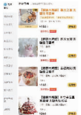
外卖平台上,南京某蛋糕店推出的木糖醇蛋糕