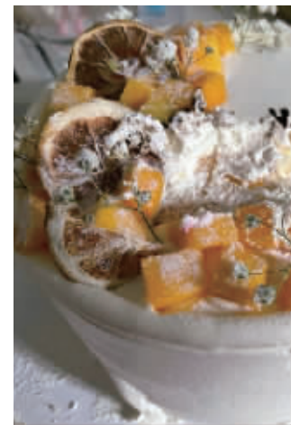
木糖醇蛋糕