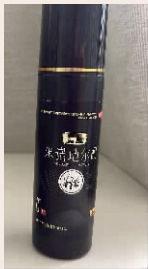
小周正在使用的米诺地尔酊