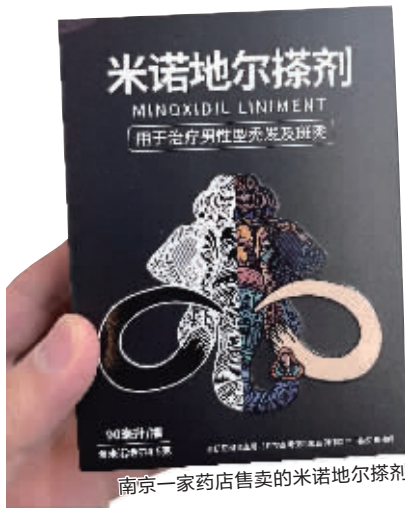
南京一家药店售卖的米诺地尔搽剂