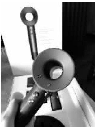
假冒的品牌吹风机

快报讯(通讯员 江公宣 记者 季雨)售价数千元的品牌吹风机，580元就可以买到？2020年以来，一制假团伙通过自行研发的生产流水线，将生产的假冒品牌吹风机销往全国多个省市。日前，这个团伙被南京江宁警方打掉，经查3名成员获利超60万元。