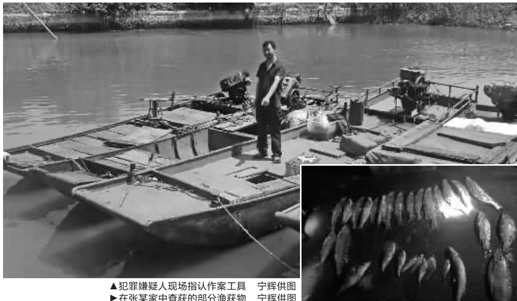
▲犯罪嫌疑人现场指认作案工具 宁辉供图 ▶在张某家中查获的部分渔获物 宁辉供图