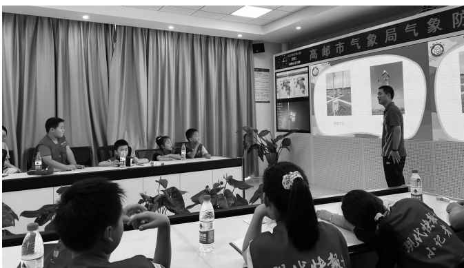
认识气象观测工具