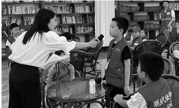
高邮供电负责人与小记者互动问答

“同学们, 你们知道电器设备灭火为什么不能用水?”“发现有人触电要怎么办?”……6月19日, 现代快报小记者来到国网高邮市供电公司, 学习了一堂生动有趣的安全用电知识课。