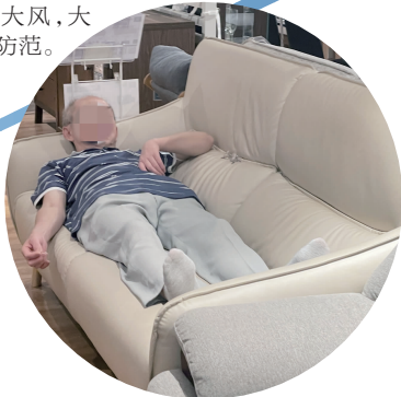
家居卖场里脱鞋躺倒蹭凉的老大爷

值得注意的是,下雨时伴有大风,江苏省气象台先后于7月19日17时17分、17时26分发布大风黄色预警和海区大风橙色预警。预警称,7月20日,徐州、连云港、宿迁、淮安、盐城、扬州北部和泰州北部将出现8~9级阵风,有雷雨地区雷雨时,局地阵风可达11级左右。此外,20日中午前后至夜间,连云港和盐城海区将出现9级阵风11级左右的大风,大家要注意防范。