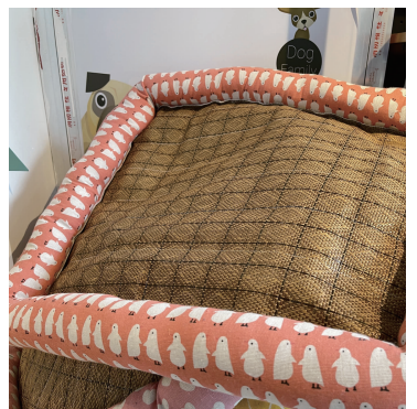
南京某宠物用品店售卖的宠物凉席