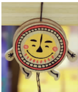
跳舞的瓦当文创产品