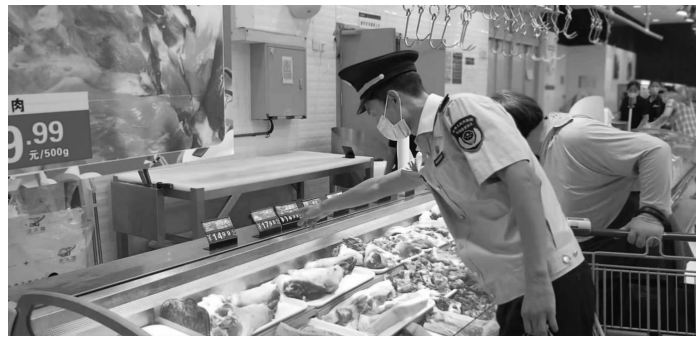
工作人员在检查

7月13日，现代快报记者来到南京江北新区一家大型农贸市场，发现多家猪肉摊位上的猪肉价格都有所上涨。记者了解到，目前，猪五花的价格在21元/斤左右，猪前腿肉的价格在23元/斤左右，猪肋骨的价格为25-30元/斤。近期猪肉价格是否有所上涨？一名摊主表示，猪肉价格两个星期前就开始涨了，每斤差不多涨了5元左右。“饲料的价格涨了很多，猪肉的价格也不稳定，不过最近有下降的势头。”根据国家统计局南京调查队发布的6月居民消费价格指数，受部分养殖户压栏惜售、疫情趋稳消费需求有所增加等因素影响，猪肉价格环比连续第三个月上涨，涨幅为3.3%。