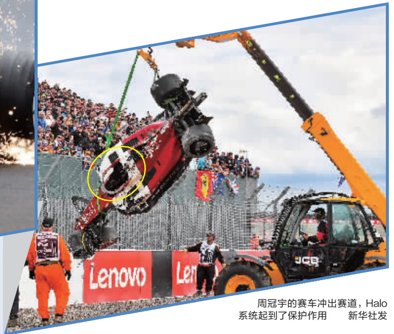
周冠宇的赛车冲出赛道, Halo系统起到了保护作用

车辆在250公里/小时左右的速度下发生碰撞凌空飞起,四轮朝天摔在地上,滑行数十米冲出赛道,撞在车迷看台的防护沟里……北京时间7月3日晚,在英国银石赛道举行的F1英国大奖赛中,阿尔法罗密欧车队的中国车手周冠宇遭遇严重翻车事故,引发全世界车迷关注。好在,遭遇严重事故的周冠宇几乎毫发无损,正常地走出赛道。他随后发文要感谢“救命恩人”——F1赛车上的Halo系统。这个外号“人字拖”的救命神器是什么?