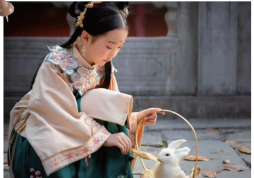
绝美红墙下汉服走秀