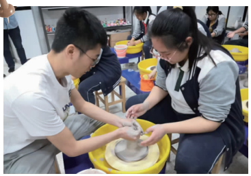
非遗学院,“复刻”文物