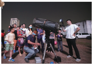
神秘天文,星空之约