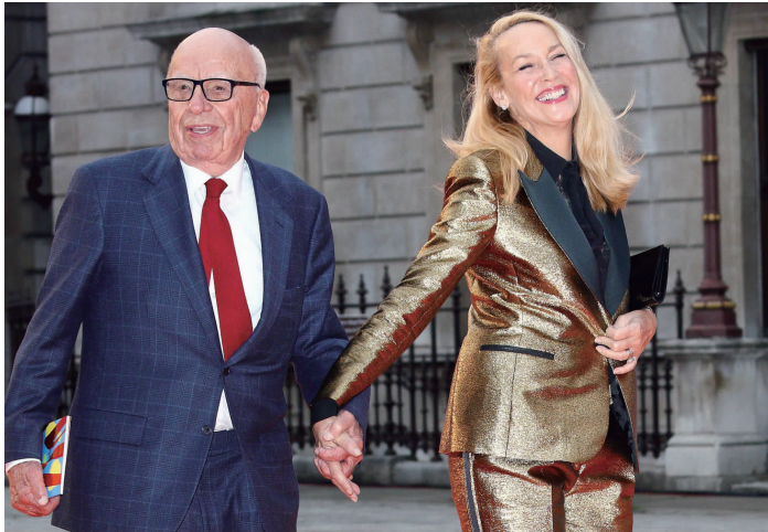
鲁珀特·默多克和第四任妻子杰丽·霍尔

据福布斯富豪榜的实时数据显示，默多克的身家高达177亿美元。目前尚不清楚默多克和霍尔是否签署婚前财产协议，外界纷纷猜测默多克的巨额财富将如何分割。2013年，默多克与第二任妻子“天价分手费”高达17亿美元。