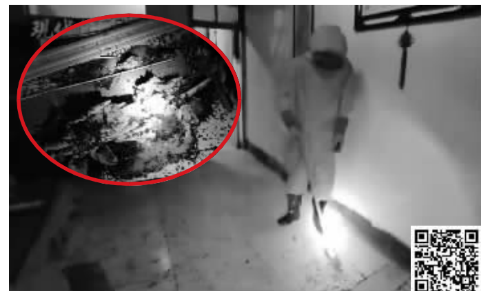
消防员清理现场(小图为掉在地上的蜜蜂和蜂巢) 扫码看视频

快报讯(通讯员 王珍 记者 张晓培)近日凌晨，徐州市贾汪区老矿街道一居民家中屋顶的巨型蜂窝掉落，压塌了天花板，满屋都是蜜蜂。接到报警后，辖区天工路消防救援站立即赶赴现场救援。