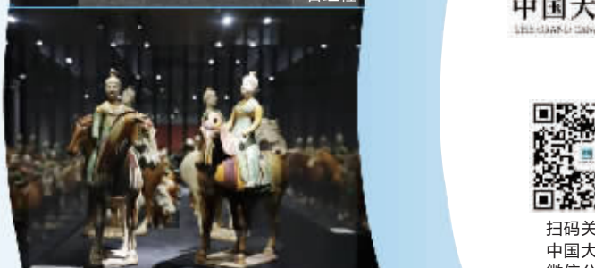
《中兹神州——绚烂的唐代洛阳城》展品