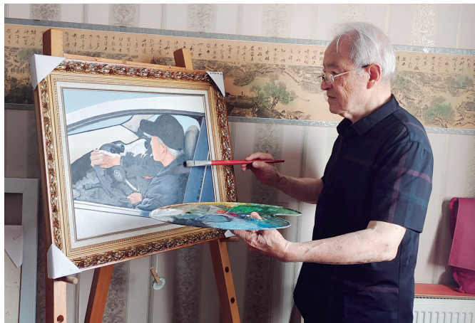
杨家杰绘画自己驾车的油画