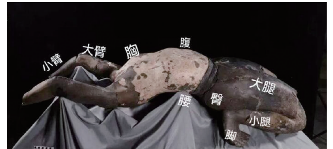
被修复的“28号俑”

秦始皇帝陵博物院考古工作又有新进展,出土于秦陵百戏俑坑的“28号俑”修复完成,这尊“仰卧俑”因其姿态奇特引起研究者关注。