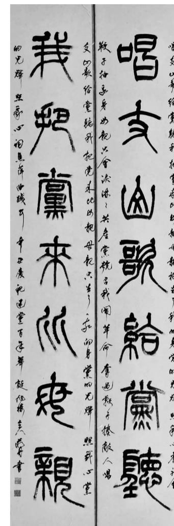
《唱支山歌给党听,我把党来比母亲》篆书 180×35cm×2

近日,“丹青抒怀——蒋丹书画作品展”亮相丹阳市档案馆。展览展出蒋丹近年来创作的书法、国画作品,包括了以篆书和隶书为主的书法作品20余幅,以及描写丹阳地域特色文化遗产的国画作品20余幅,其他山水、花鸟作品20幅,这些作品反映了作者涉猎广泛,较为全面的艺术修养。本次展览,《蒋丹书画作品集》同时首发。该作品集由中国国家画院美术研究所所长、中国美术家协会理论委员会名誉主任、中央美院教授、博士生导师邵大箴题写“水墨丹心”,著名书法家尉天池教授题签,中国评协理事、江苏省评协副秘书长衡正安作序。