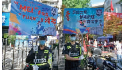
玄武公安暖心护考