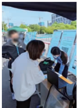
泰州考生在考场外的服务站补办临时身份证

为了更好地护航高考,高考期间,南京公安推出爱心护考“四个一”举措,全市12个考区、28个考点均设立一个公安考点服务站、一个临时身份证制证点,常驻一辆武装巡逻车、一辆爱心保障应急铁骑,为考生提供优质高效的服务。