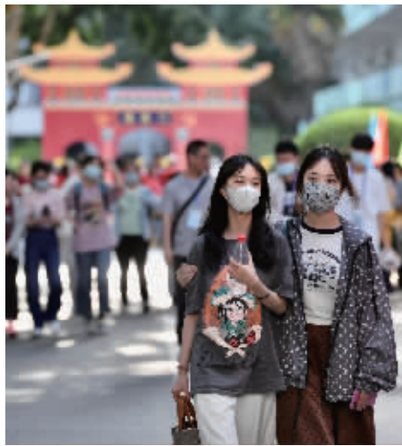
南京九中考点,考生走出考场