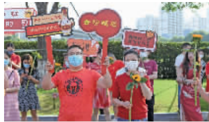
金陵中学河西分校送考家长为考生助威