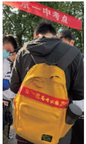
以“必胜”的信念迎战高考