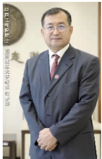
南京理工大学校长 付梦印