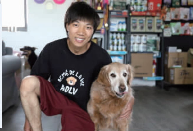
“大腿”和他养的第一只金毛狗 受访者供图