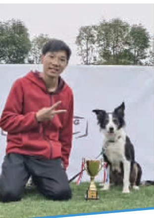
“大腿”获奖时的合影

指令。他的话音刚落,这只机警的两岁边牧就以最快的速度给出回应。坐下、卧倒、倒立……主人给出的指令难度越来越高,而它执行起来没有丝毫犹豫,甚至能配合主人完成一些高难度的花式动作。