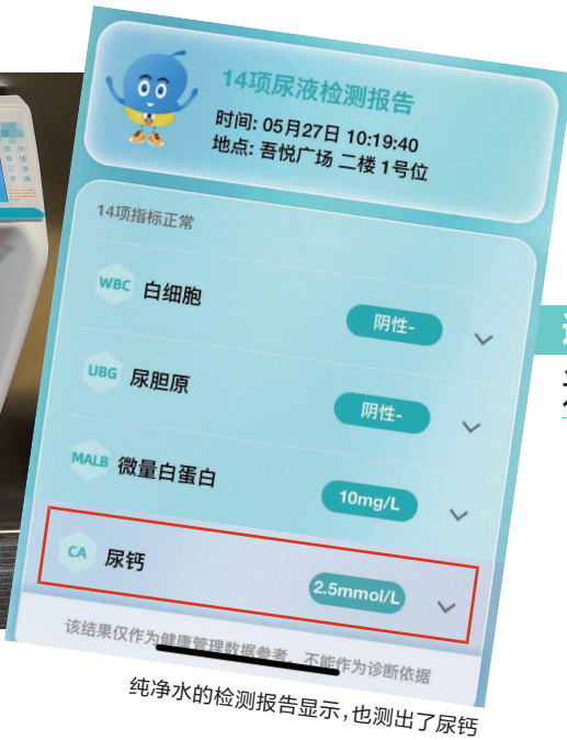
纯净水的检测报告显示，也测出了尿钙