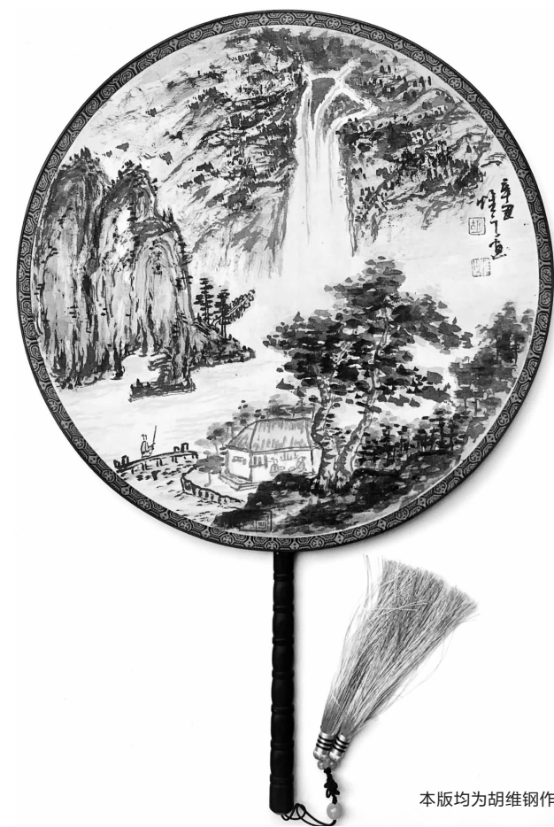
本版均为胡维钢作品