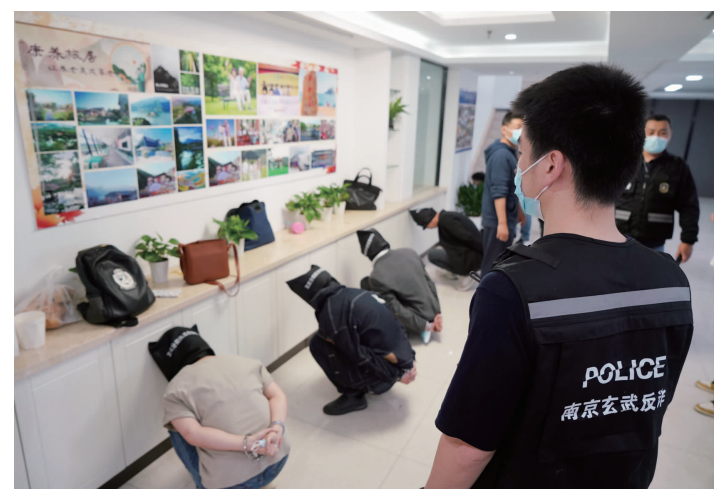
抓捕嫌疑人现场