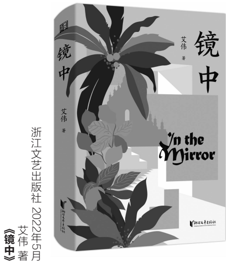
浙江文艺出版社 2022年5月 艾伟著 《镜中》

浙江省作协主席、当代中坚实力派作家艾伟的最新长篇小说《镜中》近日由浙江文艺出版社·KEY-可以文化推出。小说穿越中国、缅甸、美国、日本四个国度,缓缓编织出一张疑窦重重的迷网,困缚于其中的四人皆怀着隐秘的罪孽,各自踏上殊途同归的救赎之旅。作者艾伟尤擅挖掘人性幽微处的矛盾与张力,本书作为他沉潜五年的自我超越之作,在承继两性关系这一创作母题的基础上,对于如何纾解东方人灵魂困境这一问题做出了细腻剖析与回应。