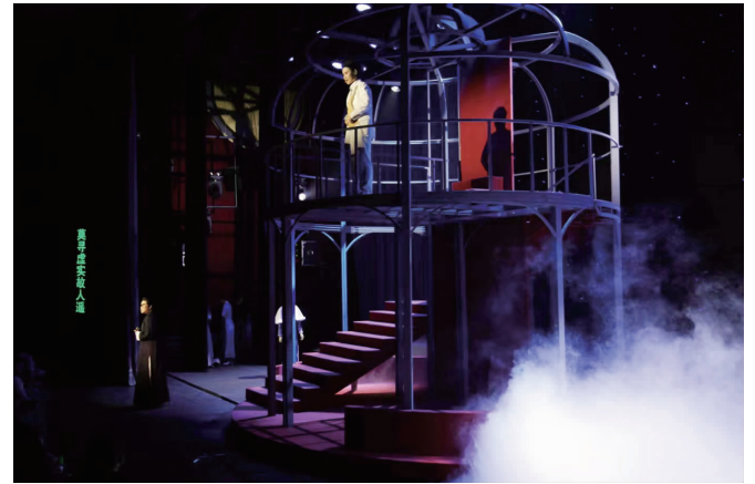
越剧《金粉世家》演出剧照

5月20日晚,越剧《金粉世家》首次公演在南京大华大戏院进行。现代快报记者获悉,这是大华大戏院2022年的开箱演出。与此同时,有着百年历史的民国建筑大华大戏院推出了100天焕颜新生计划,将打造成集电影、戏剧、商业、博物馆于一体的“文学+”空间,为“世界文学之都”南京增添一座新颖别致的文化地标。