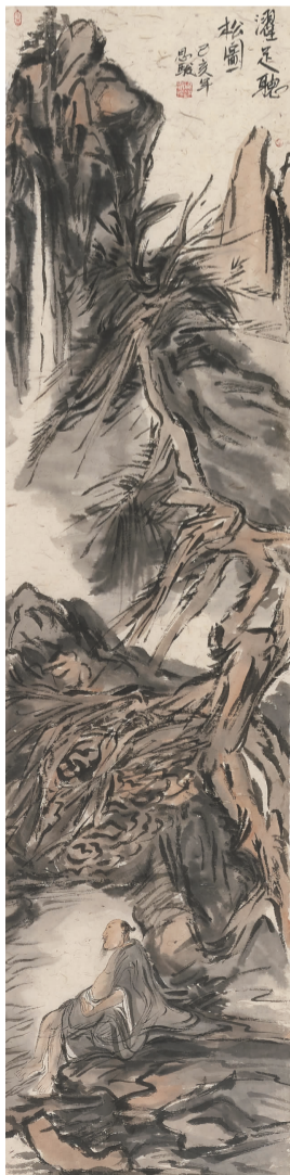
吴思骏《濯足听松图》