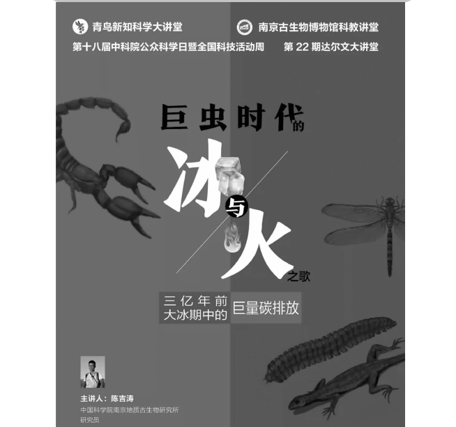
“巨虫时代的冰与火之歌”讲座海报