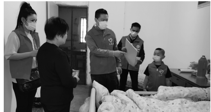
志愿者走访慰问残疾人家庭

近日,在新吴区梅村街道泰伯三社区,进行了一场温暖人心的助残扶残活动,志愿者来到社区内需要帮助的残疾人家庭中送温暖。这些志愿者中,不乏年龄较小的小志愿者。社区内一抹抹“志愿红”来回穿梭,成为一道温暖人心的亮丽风景线。