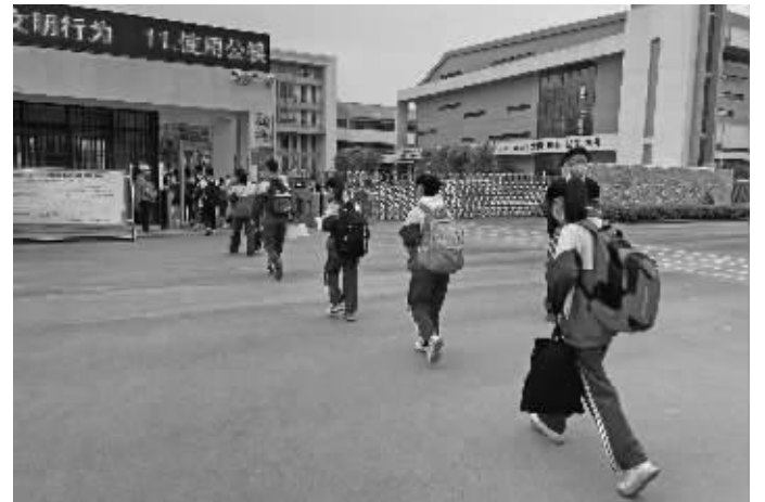
学生有序返校复课

盼望着,盼望着,在这春去夏来的时节,我们终于盼来了复学的这一天。根据沛县新型冠状病毒肺炎疫情防控应急指挥部学校防控组发布的通知,5月9日,沛县四五六六年级恢复线下教育教学,美好的事情终于如约而至。