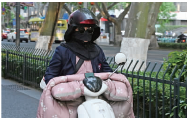
为防“毛毛雨”,市民出行全副武装