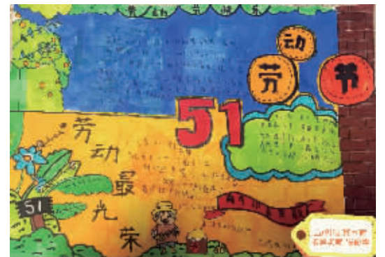
五(9)班 樊雨荷 指导老师:张俊华