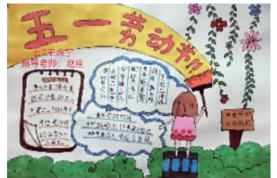
五(2)班 王烁宁 指导老师:赵臣