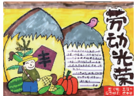
五(10)班 王冠祥 指导老师:侯冰冰