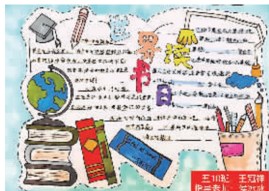
五(10)班 王冠祥 指导老师:侯冰冰