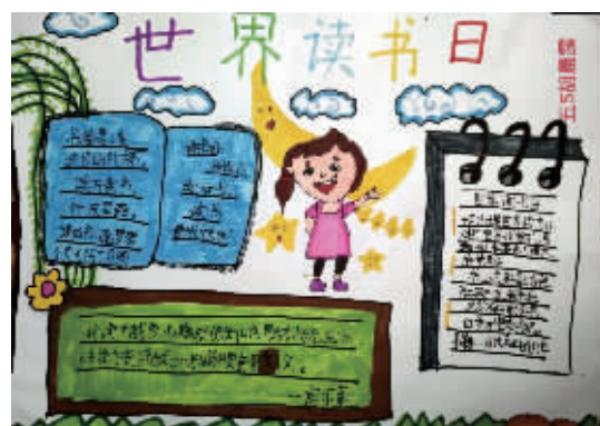
五(5)班 胡晨露 指导老师:陈厚礼