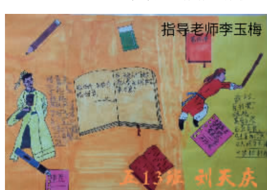
五(13)班 刘天庆 指导老师:李玉梅