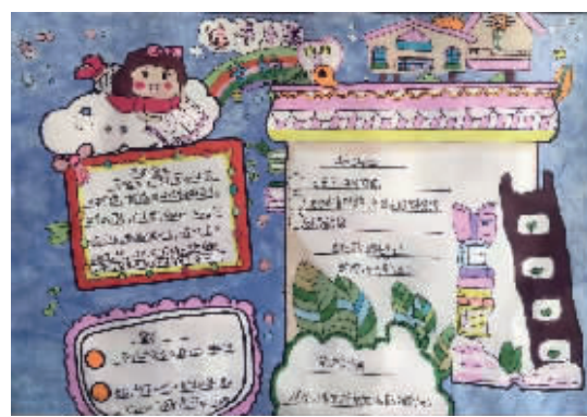
三(11)班 张欣悦 指导老师:赵莎莎