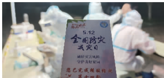
特色核酸检测采样卡

3月份以来,梅村街道已开展了十多轮全员核酸检测,近日,尚品社区在第14个全国防灾减灾日