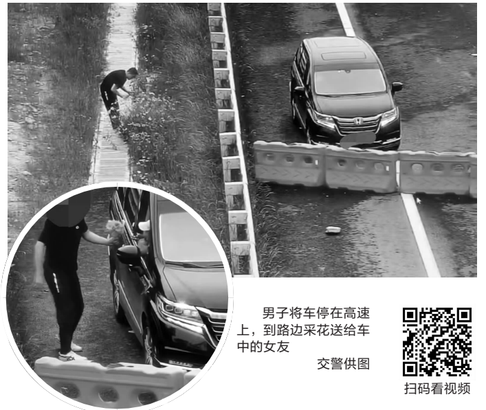
男子将车停在高速上,到路边采花送给车中的女友