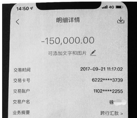
购房者付给嫌疑人的转款记录