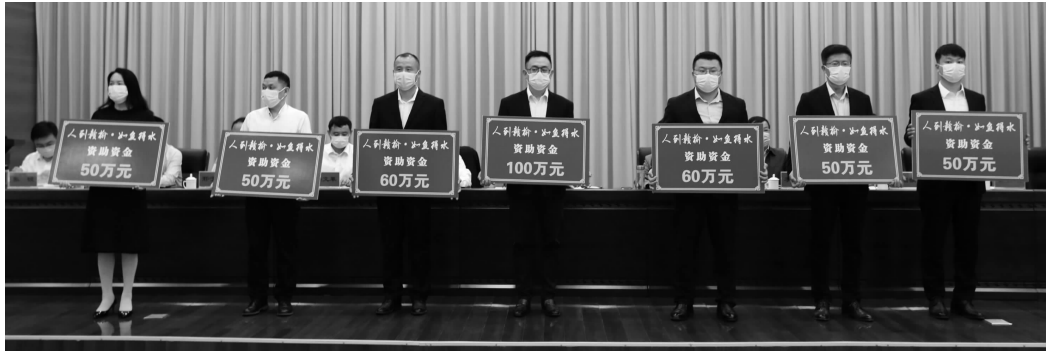
赣榆区委人才工作会议现场颁发资助资金

近日,连云港市赣榆区委召开人才工作会议。会上,《全力打响“人到赣榆 如鱼得水”人才品牌加快建设人才工作先行区的若干政策意见》(下文简称《政策》)重磅出炉。《政策》全面承接了市级综合补贴、生活补贴等内容,做到无缝衔接、有效对接,覆盖产业人才、青年人才、海外人才、民生人才、技能人才等各类群体,贯穿人才引、育、留、用各个方面。尤为重要的是,2022年区级人才专项资金投入较往年将实现翻番,达到2000万元,各类人才支持补贴标准也将大幅提高:顶尖人才给予最高1亿元的综合资助,重点产业人才给予最高1500万元创新创业资助和最高200万元购房券。青年人才享受购房券和连续三年的生活补贴。赣榆籍毕业生返乡、海外人才回国可享受额外补贴。同时,支持市场化引才、柔性引才,多渠道集聚优秀人才。鼓励企业聘任科技副总,择优给予每人5万-15万元资助。