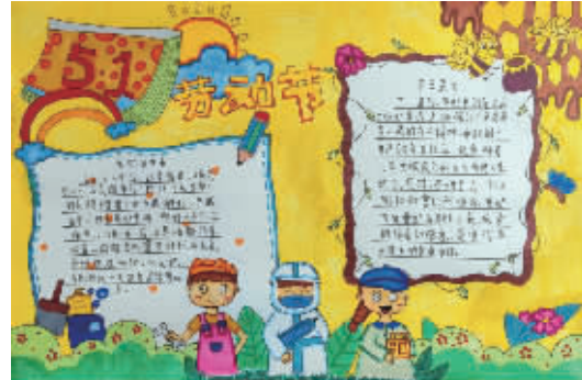
六(2)班 王炳然 指导老师:姜延艳