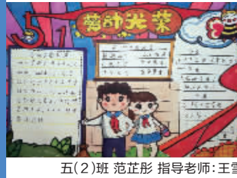
五(2)班 范芷彤 指导老师:王雪