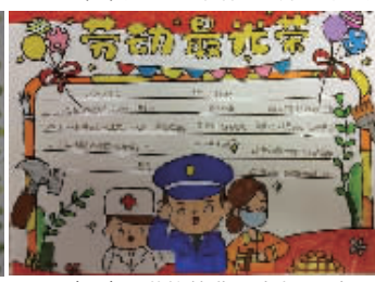
五(13)班 苑怡梦 指导老师:于春朋