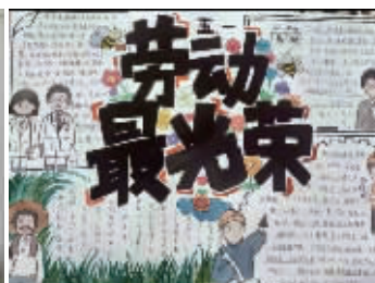
六(8)班 刘璟涵 指导老师:王秀玲