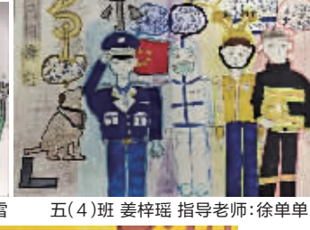
五(4)班 姜梓瑶 指导老师:徐单单