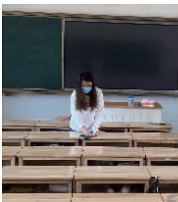
班主任打扫教室静等学子归来