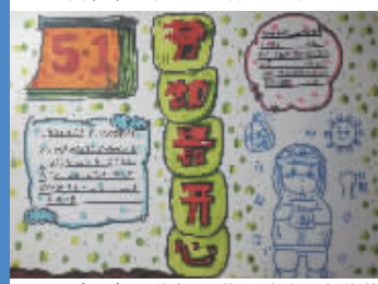
六(14)班 曹馨予 指导老师:朱燕莹