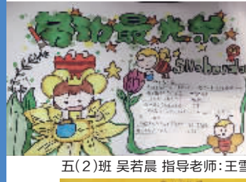
五(2)班 吴若晨 指导老师:王雪