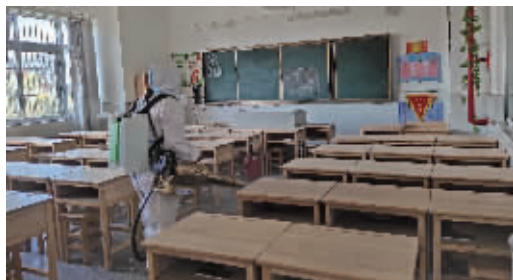
沛县猎鹰应急救援队义务帮助学校进行全方位专业病毒消杀