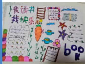
四(2)班 徐长雯 指导老师:冯兴敏