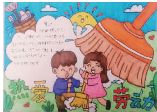
六(14)班 吴韦烨 指导老师:朱燕莹