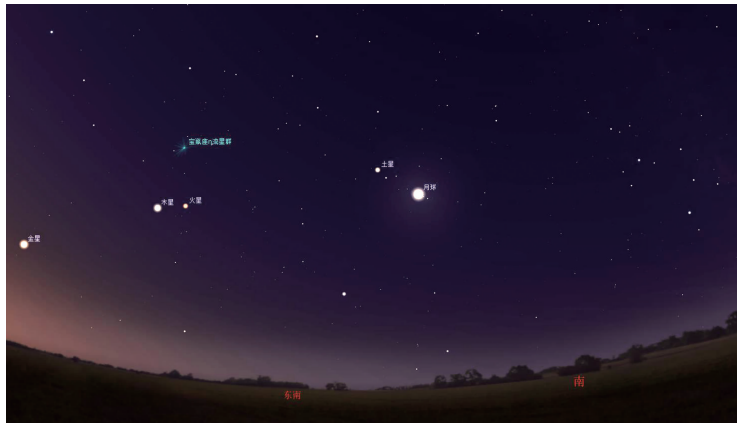
土星合月